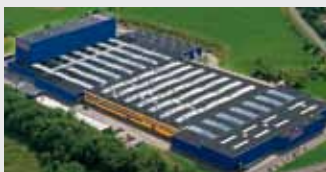
Hörmann KG Freisen, Allemagne