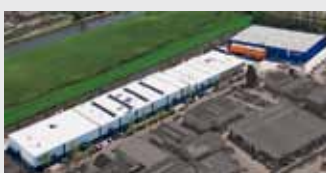
Hörmann Alkmaar B.V., Pays-Bas