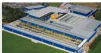
Hörmann KG Brockhagen, Allemagne