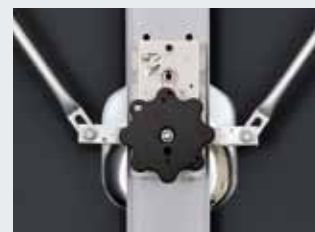
Poignée intérieure, serrure à cylindre profilé, barres de verrouillage pour les locaux du matériel sportif