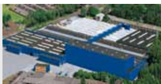
Hörmann KG Amshausen, Allemagne