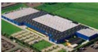
Hörmann KG Brandis, Allemagne