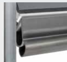
Protection élastique contre le pincement des pieds