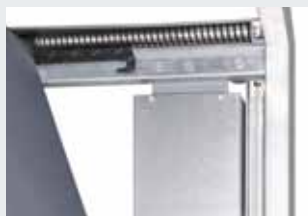
Guidage de porte sûr dans des rails de guidage horizontaux et verticaux, ouverture et fermeture amorties par des amortisseurs de butée