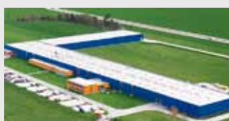
Hörmann Legnica Sp. z o.o., Pologne