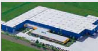
Hörmann KG Dissen, Allemagne