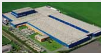
Hörmann KG Ichtshausen, Allemagne