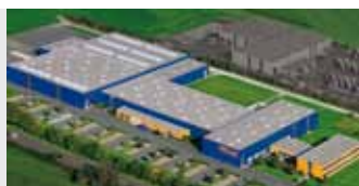
Hörmann KG Antriebstechnik, Allemagne