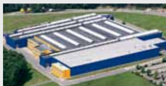
Hörmann KG Eckelhausen, Allemagne