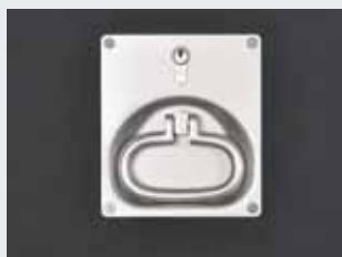
Poignée coquille affleurante côté hall