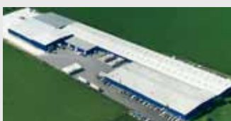
Hörmann LLC, Montgomery IL, USA