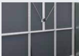
Construction stable à tube carré, avec entretoises de renforcement