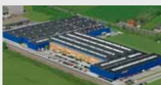
Hörmann KG Werne, Allemagne