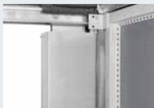
Habillage intégral des contrepoids