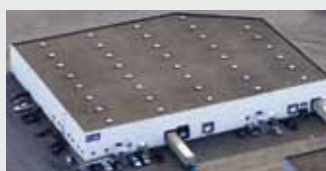
Hörmann Flexon, Leetsdale PA, USA

En tant que seul fabricant complet sur le marché international, le groupe Hörmann propose une large gamme d'éléments de construction, provenant d'une seule source. Ils sont fabriqués dans des usines spécialisées suivant les procédés de fabrication à la pointe de la technique. Grâce au réseau européen de vente et de service, orienté vers le client et la présence sur le marché aux Etats-Unis et en Chine, Hörmann se positionne comme votre partenaire international performant pour tous les éléments de construction. Hörmann, l'assurance de la qualité.