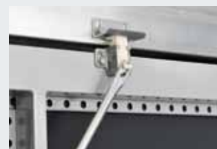
Verrouillage à gâche à blocage automatique