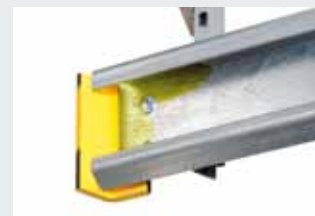
Habillage antichoc des extrémités de rails de guidage